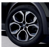
Jante aliaj 18", design Pasadena Grey Erbe (RALU18/RDIF21)

* NA406 nu suporta replicarea navigatiei pe afisajul de bord TFT 10 inch. NA418 si NA419 pot face replicarea navigatiei pe afisajul de bord TFT 10 inch.