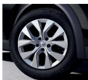
Jante aliaj 17", design Bahamas Sparkling Silver (RALU17/RDIF10)